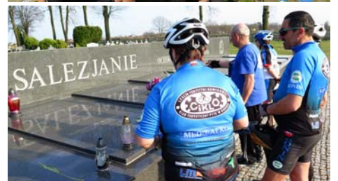
CIKLO, RRR, Żwawe Dziadki w CHATCE ORNITOLOGA PTTK