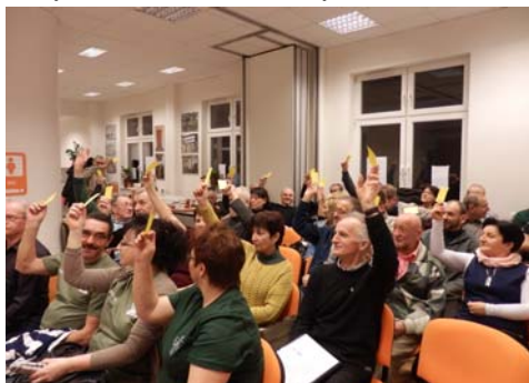
Głosowano kolorowymi mandatami.