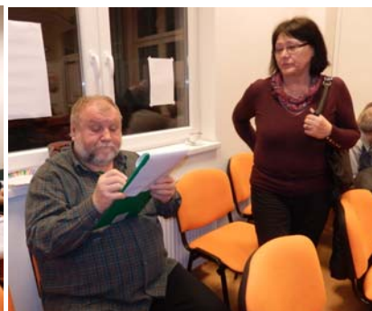
Sekcja krajoznawcza i kajakowa w działaniu.