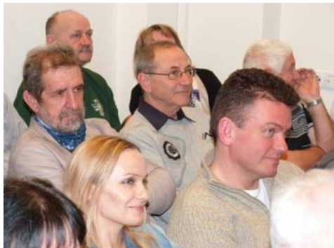
Nowy członek w otoczeniu aktywu CIKLO i BOJE.