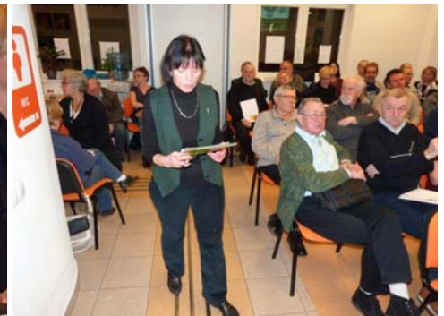
Komisja rewizyjna czyta sprawozdanie.