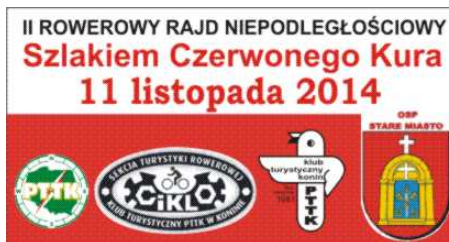
Naklejka wydana sumptem PTTK Konin.