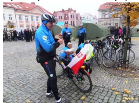
Pyszna grochówka na zakończenie.