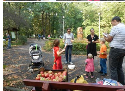
Na starcie na Placu Wolności i na mecie w parku im. Fryderyka Chopina w Koninie