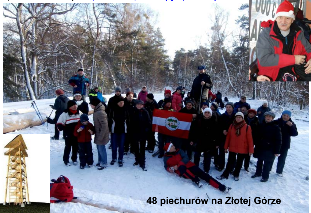
48 piechurów na Złotej Górze