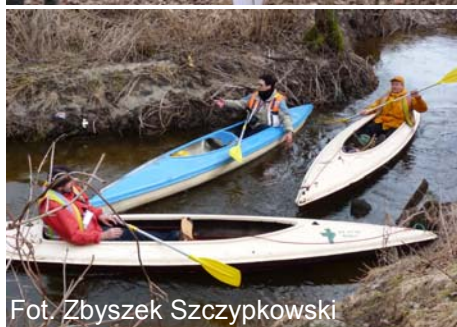
Fot. Zbyszek Szczypkowski