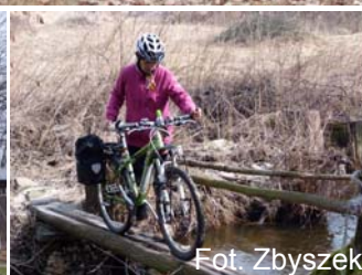
Fot. Zbyszek Szczypkowski