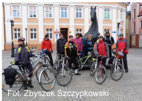
Fot. Zbyszek Szczypkowski