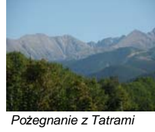
Pożegnanie z Tatrami