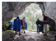
Wlot Jaskini Mylnej