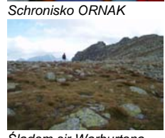
Śladem sir Warburtona