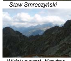
Widok z przeł. Krzyżne