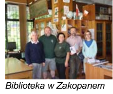
Biblioteka w Zakopanem