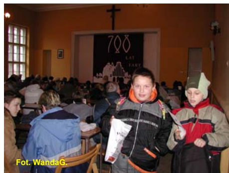
Koledzy już myślą o następnym spacerze