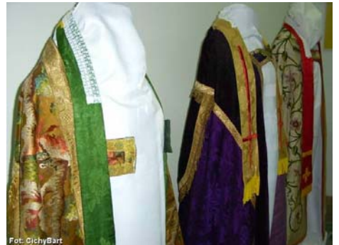
Zabytkowe szaty liturgiczne