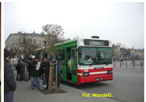
Takiego autobusu jeszcze w Kole nie było!

Więcej zdjęć i mapka trasy na http://konin.pttk.pl .