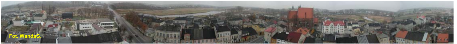
Panorama Koła z wieży ratuszowej