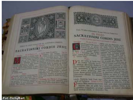
Księga z uposażenia fary