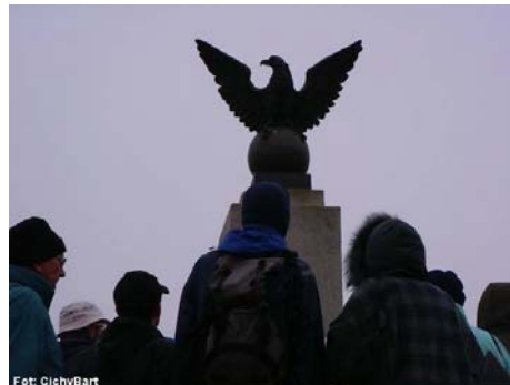
Orzeł z pomnika Obrońców Ojczyzny