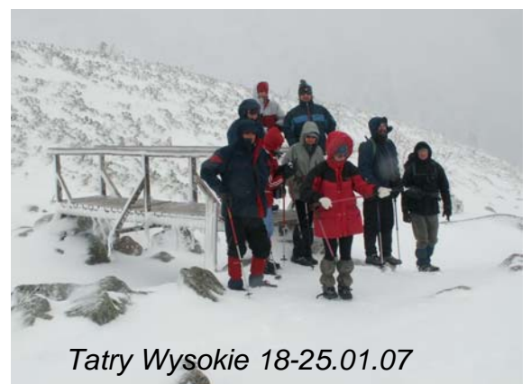
Tatry Wysokie 18-25.01.07