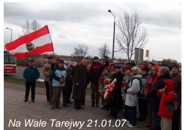
Na Wale Tarejwy 21.01.07