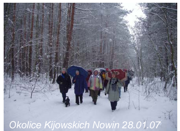
Okolice Kijowskich Nowin 28.01.07