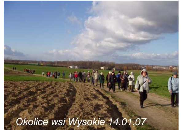
Okolice wsi Wysokie 14.01.07

Tekst: Wanda Gruszczyńska, Mira Ewa Olszak