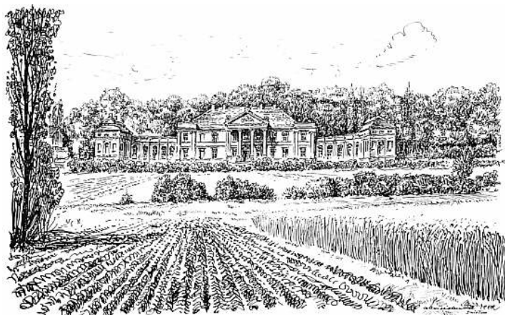
Śmielów – pałac