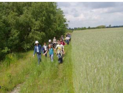
W okolicy Anielewa