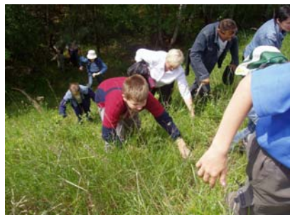
Strome podejścia pokonywano przy pomocy rąk