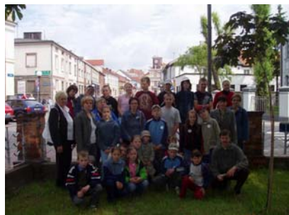
Reprezentacja Łuczywna liczyła 31 osób