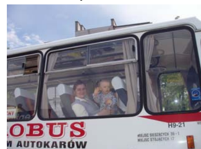
Do zobaczenia za rok!