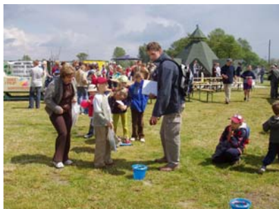
Konkursy i zabawy na mecie