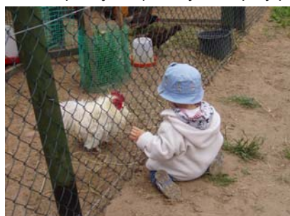
Oko w oko – kto z nas jest starszy?