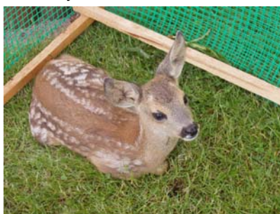
Osierocona sarenka znalazła opiekę w mini-zoo