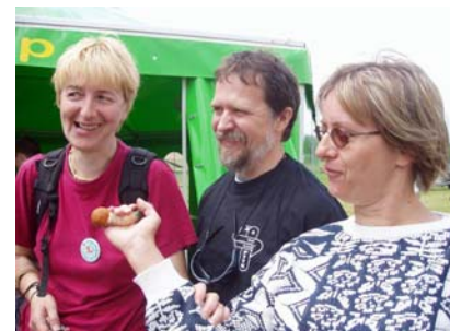
Grzyb krawiec znaleziony na trasie nr 2