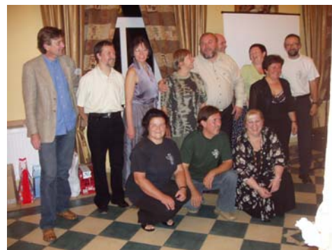
Remake zdjęcia poniżej