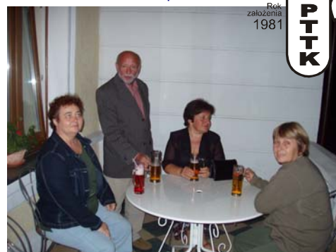
Założycielki Klubu z Tomkiem