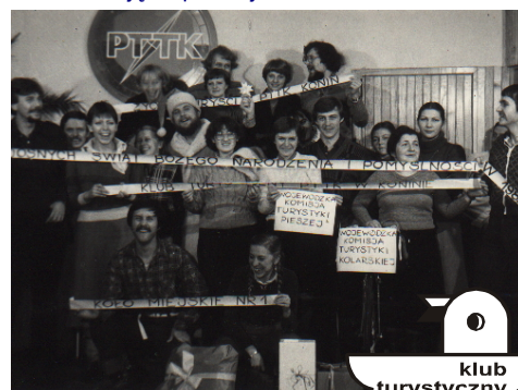
Pierwsze Walne 26 listopada 1981