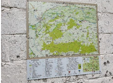
Przybyła mapa szlaków rowerowych

Na koniec sierpnia zjechała ekipa z Jarocina, Goliny, Łodzi, Kalisza, Konina i Krotoszyna.