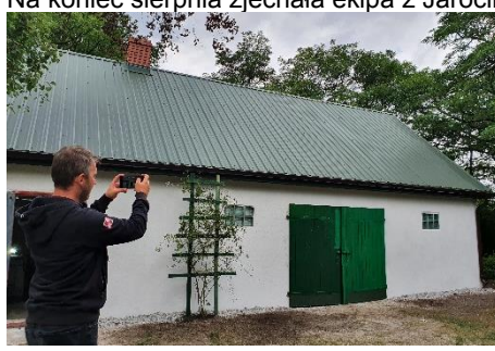
Odbiór techniczny odbył się 27 sierpnia 2021 r. Po nim weszła „międzynarodowa” ekipa.