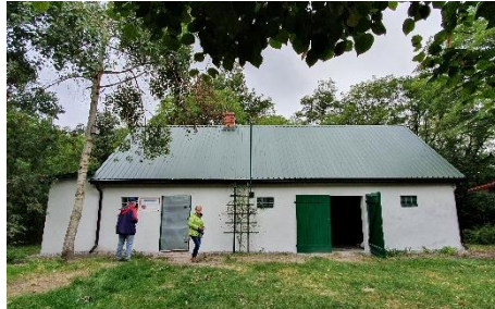
Stara drewnitnia już bez eternitu ma cały dach, odnowioną i łazienkę i świetlicę deszczową.