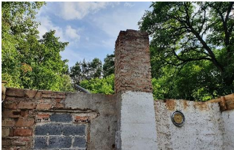
W czerwcu został zdjęty eternit z dachu drewni.