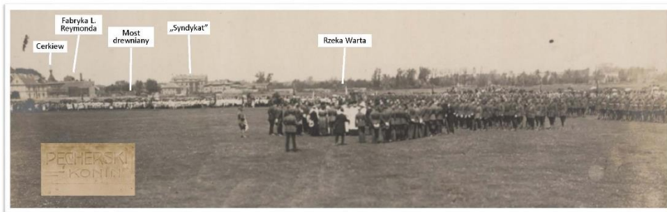
Uroczystość na konińskich błoniach 10 lipca 1921 r.