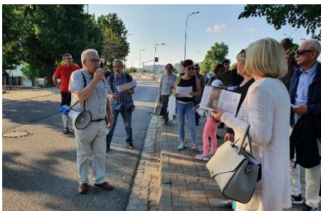
Tędy wjeżdżały powozy z Czarkowa