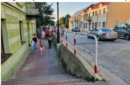
Poziom ulicy był niższy i równy z mostem drewnianym