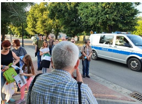
Tu stała brama powitalna. Lip jeszcze nie było