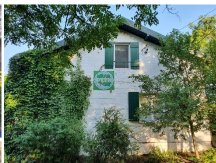
Ściana wschodnia o poranku