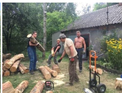
Po zakupie opału w leśnictwie Benewicze