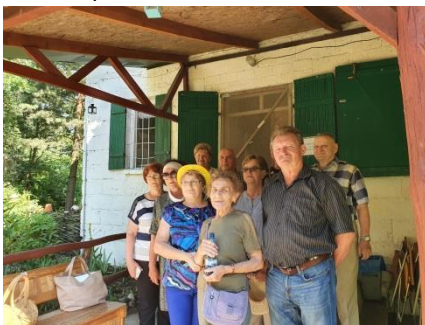
Chatkę chętnie odwiedzają Pyzdrzanie