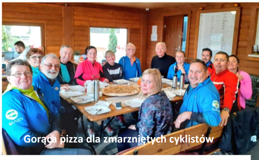
Gorąca pizza dla zmarzniętych cyklistów