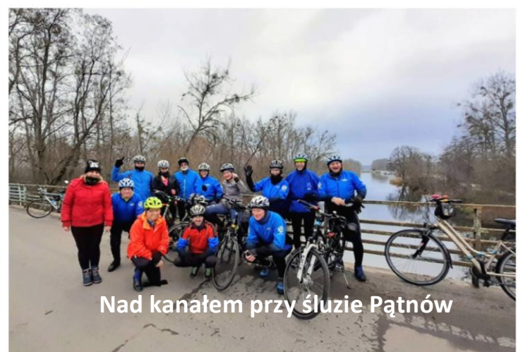
Nad kanałem przy służce Pątnów

1 grudnia 2019 roku - niech ta data będzie symbolem rozpoczęcia rowerowego sezonu zimowego przez CIKLO PTTK. I tak to 14 odpornych na chłód wyruszyło z dworca PKP w Koninie do Ślesina na spotkanie z Pawełkiem termami i skorzystania z gościnności Pizzerii K 2, potem to już Licheń i bezdrożami do miejsca zamieszkania. A teraz to czekamy na kolejny weekend i liczymy na stosowny do tej pory mroziak .