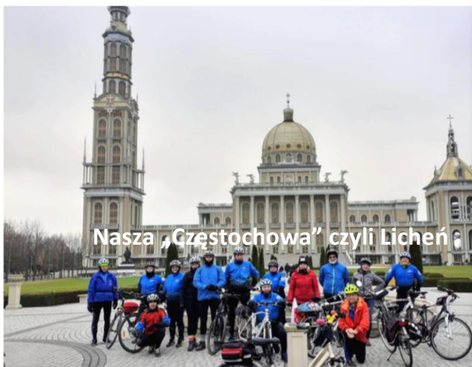
Nasza „Częstochowa” czyli Licheń