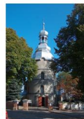
Kościół w Sławsku, w którym Zofia została ochrzczona 13 września 1849 r.

W trakcie Konińskiego Roku Zofii Urbanowskiej turyści z Konina i Sławska zachęćli do odwiedzin świątyni w Sławsku, w której malutka kandydatka na pisarkę została ochrzczona 13 września 1849 roku. O godz. 16.00 sobotę 14 września 2019 roku, niemal w 170. rocznicę pamiętnego wydarzenia, ks. kan. mgr Benedykt Gembicki, proboszcz parafii pw. św. Wawrzyńca w Sławsku, odprawił uroczystą mszę świętą w intencji śp. Zofii Urbanowskiej.