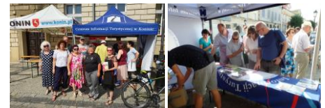
Na stoisku Centrum Informacji Turystycznej można było uzyskać informacje o mieście i regionie, wystartować na spacer-y i rozegrać grę rodzinną "Konin Zofii Urbanowskiej" TPK i PTTK