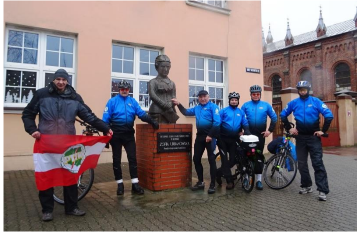
NOWY Rok rowerami powitało 7 osób.

Członkowie sekcji kajakowej BOJE Klubu Turystycznego PTTK Polskiego Towarzystwa Turystyczno - Krajoznawczego w Koninie powitali nowy rok w typowy dla siebie sposób. Tuż przed południem z Bulwaru Nadwarciańskiego ruszył noworoczny spływ kajakowy. Pomimo mało sprzyjającej aury 6 osad stawili się na konińskim bulwarze, skąd wyruszyli kajakami do Rumina. Żegnał ich prezes Oddziału PTTK w Koninie Andrzej Łącki.