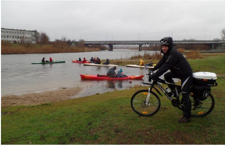
Spłynęło 6 załóg (13 osób)

Członkowie sekcji kajakowej BOJE Klubu Turystycznego PTTK Polskiego Towarzystwa Turystyczno - Krajoznawczego w Koninie powitali nowy rok w typowy dla siebie sposób. Tuż przed południem z Bulwaru Nadwarciańskiego ruszył noworoczny spływ kajakowy. Pomimo mało sprzyjającej aury 6 osad stawili się na konińskim bulwarze, skąd wyruszyli kajakami do Rumina. Żegnał ich prezes Oddziału PTTK w Koninie Andrzej Łącki.