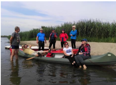
Na trasie kajakowej Wartą do Białobrzegu.

Tekst: W. Gruszczynska