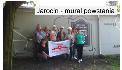
Jarocin - mural powstania