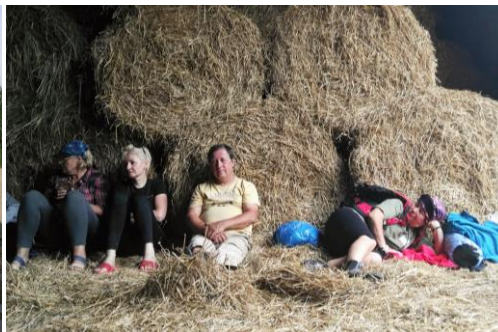
W stodole w Ciężeniu