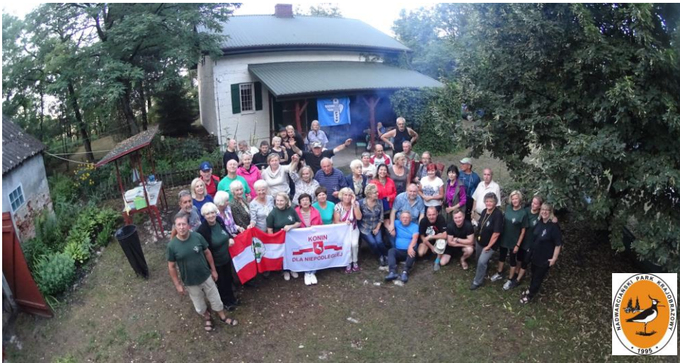
Chatka Ornitologa PTTK to baza turystyki kwalifikowanej Oddziału PTTK w Koninie