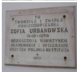
Tablica z lat 1957-2011