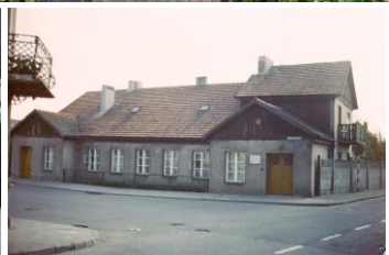
Dworek w 1978 roku