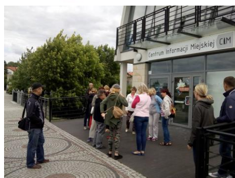
Letnie spacerki rozpoczynają się przed Centrum Informacji Miejskiej o godz. 13:00