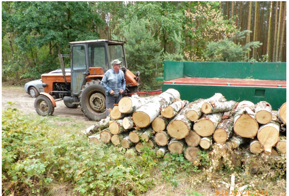
Zakupione w leśnictwie drewno do ognisk przy CHATCE i do kominka