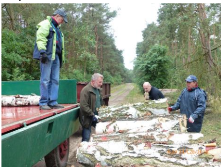
Ciężkie belki dały się we znaki