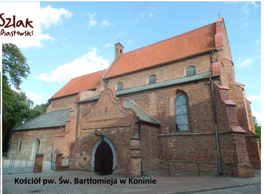
Kościół pw. Św. Bartłomieja w Koninie

Miasto Konin jest członkiem Klastra turystycznego Szlak Piastowski w Wielkopolsce