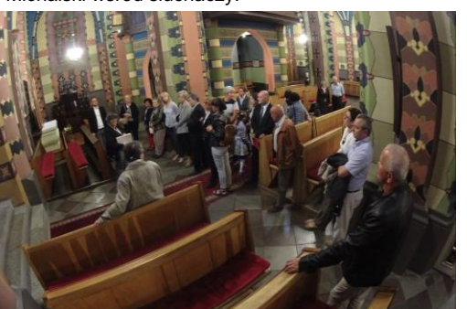
Zwiedzanie najstarszej świątyni w królewskim Koninie