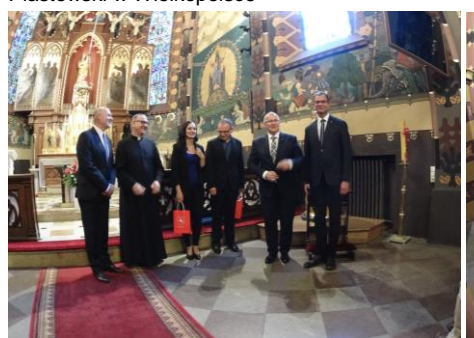
Wykonawcy z konińskimi upominkami