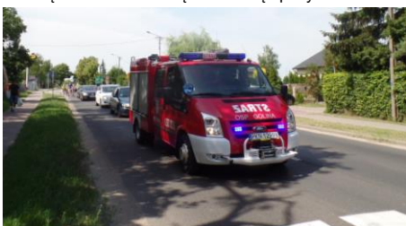
Grupę z Radoliny pilotowali strażacy