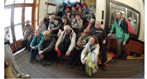
Słynne schody w Szkole Filmowej