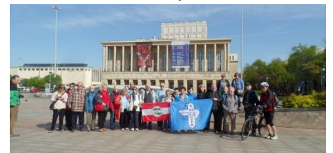
Przed Teatrem Wielkim w Łodzi

Gruszczyńscy wykorzystali rowery do wieczornych przejażdżek i eksploracji Łasku Łagiewnickiego.