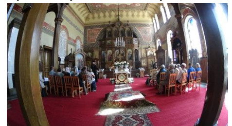
Kutia w cerkwi św. Mikołaja w Łodzi