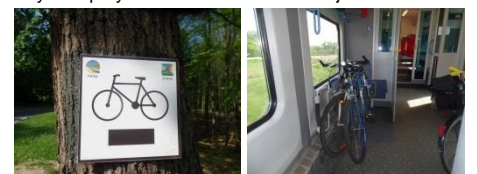
Szlaki rowerowe znakowane są przez Zespół Parków Krajobrazowych. Koleje Wielkopolskie i Łódzka Kolej Aglomeracyjna mają preferencyjne warunki do przewozu rowerów swoim taborem.

Tekst i fot. Zbigniew Szczypkowski i Wanda Gruszczyńska 29-04-2018