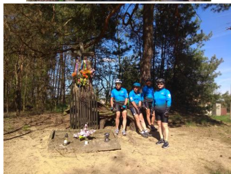
Cmentarz żydowski pod Zagórowem