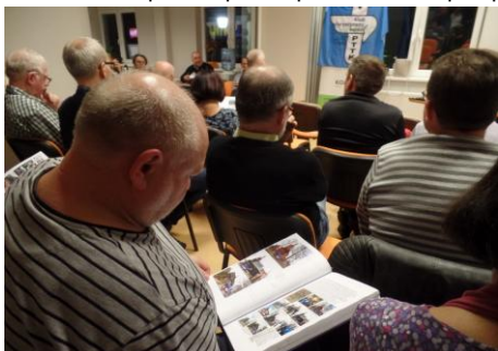
Powodzeniem cieszyły się kroniki.