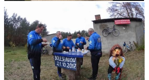
Błękitny stół w towarzystwie kukielki