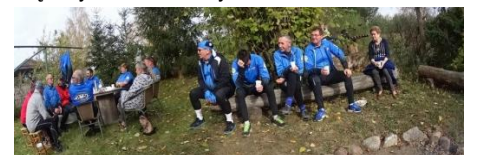
Długie rozmowy przy ognisku