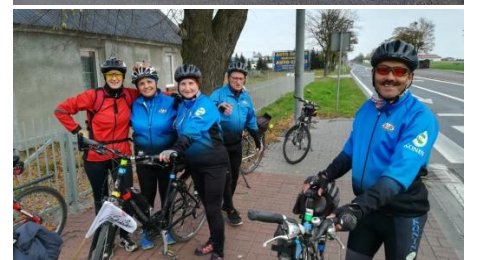
Pora odjeżdżać. Jeszcze 30 km do Goliny!