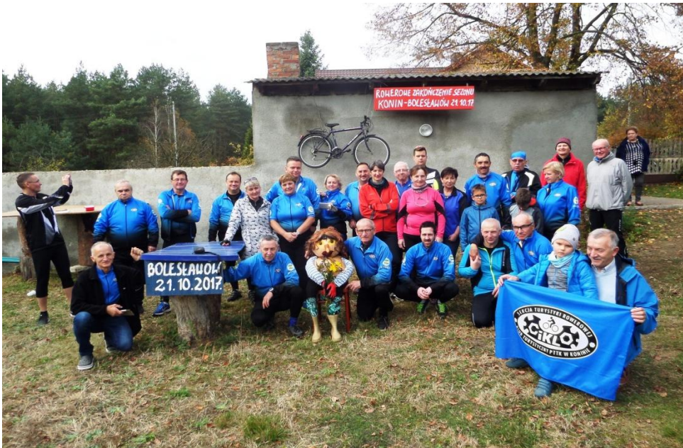
U Ani i Kazia czekały powitalne transparenty