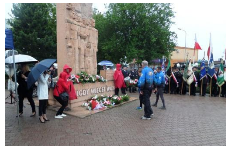
Kierownictwo rajdu składa wiązanekę