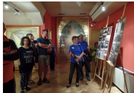
Nocne zwiedzanie muzeum i kościoła