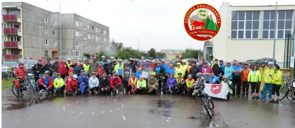
Ponad stu rowerzystów wystartowało o 9 rano na trasę Turek – Psary – Brudzew – Galew - Turek

Tekst: W. Gruszczyńska