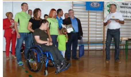
Ekipa organizacyjna PTTK Turek i kwaternistrz