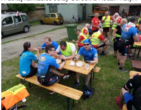
Punkt posiłkowy w Anastazewie.

http://www.konin.pl/index.php/jeden-news/items/raid-pamieci-ofiar-zbrodni-katynskiej.html