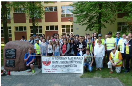
Zbiórka w Koninie