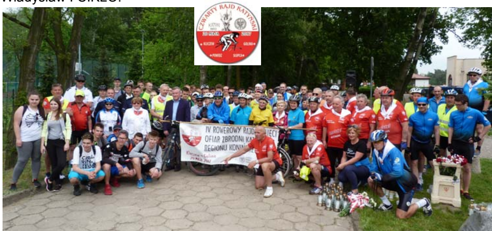
Uczestnicy rajdu w Słupcy