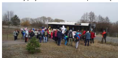
Skraj wsi Głodowo – zaczynamy spacer