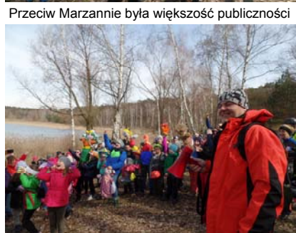
Niezawisły sędzia tuż przed ogłoszeniem wyroku