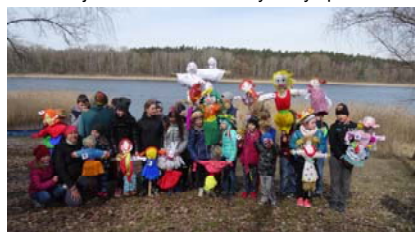
17 Marzann jak 17 mgnień wiosny