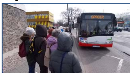
Główny przystanek linii SPACER pod wieżą

Zdjęcia: Marek Chlebicki, Stefan Dobrecki, Wanda Gruszczyńska (tekst), Piotr Pęcherski i Bogdan Rachuba. Korony zrobiły Wanda i Majka Gruszczyńskie.