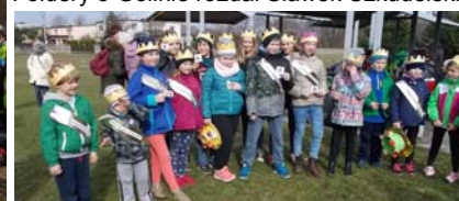
Radosne miss i mister WIOSNA '2017