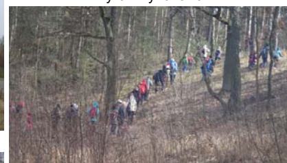
Wyjście z niecki jeziora zielonym szlakiem