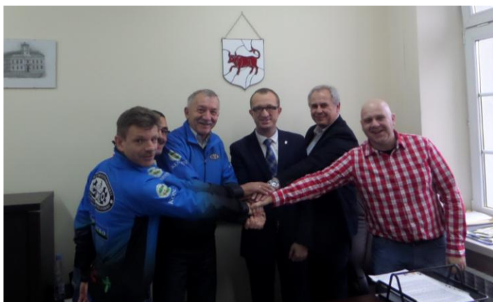
Już po wstępnych rozmowach doszło do porozumienia.