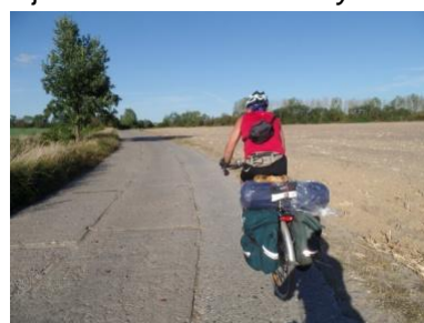
Koniński delegat i autor zdjęć.

Księżych Młynów przez Miłaczew nakręcił 90 km. Z powrotem przez Złotkowy przejechał 110 km. Łącznie z trasą rajdu do Poddębic na liczniku przybyło 260 km. Spotkanie było owocne i miłe, bo wielu członków ŁKTK dało się poznać na naszych rajdach.