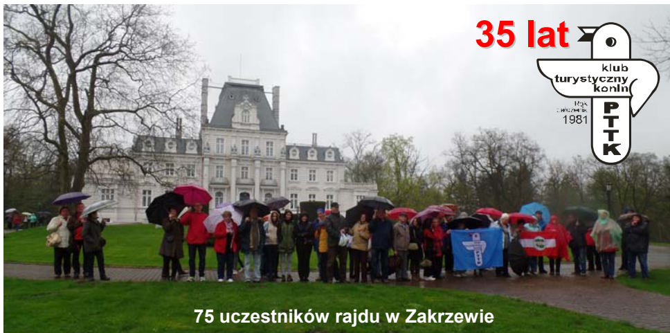
75 uczestników rajdu w Zakrzewie