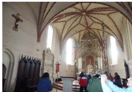
Łekno. Pocysterski kościół św. Piotra i Pawła