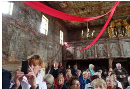
Tarnowo Pałuckie, kościół św. Mikołaja