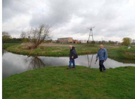
Skrzyżowanie rzek: Wełny i Nielby w Wągrowcu