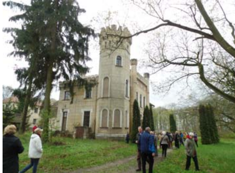
W Wiatrowie dwór barokowy przebudowany w 1856 r. przechował pamięć o Moszczeńskich.