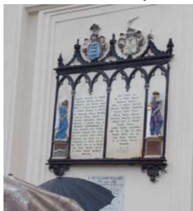
Epitafium Węsierskich w Sławnie