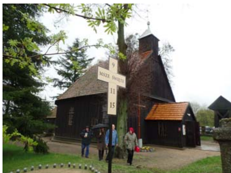
Rejowiec zał. przez Andrzeja Reja z tablicami trumiennymi szlachty kalwińskiej.