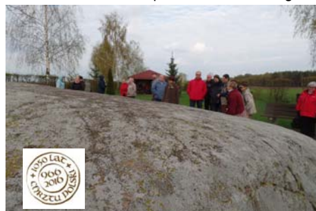
Kamień św. Wojciecha w Budziejewku.