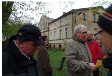
Podlesie Kościelne Napoleona Rutkowskiego