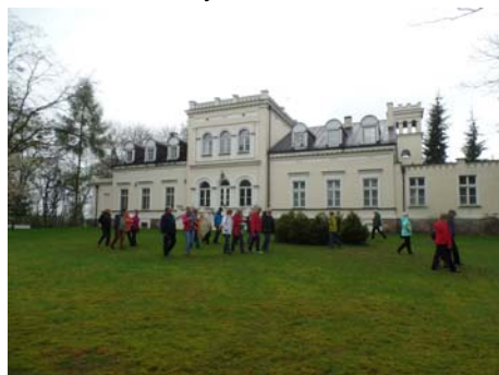
Skoki. Pałac z 1870 r. użytkowany jako dom plenerowy Uniwersytetu Artystycznego w Poznaniu