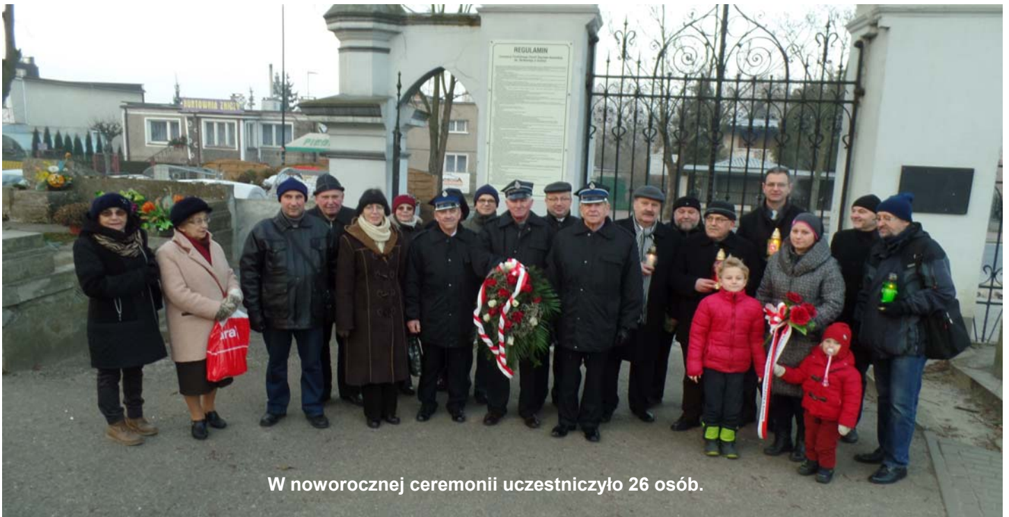
W noworocznej ceremonii uczestniczyło 26 osób.