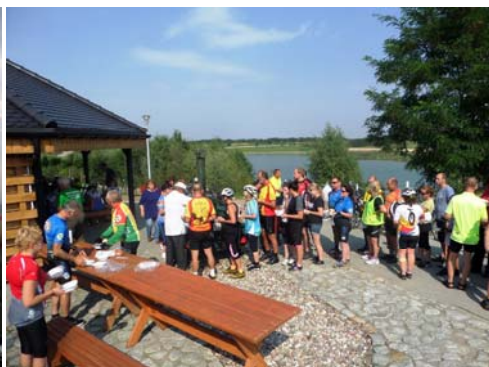
Park Rekreacji w Kleczewie