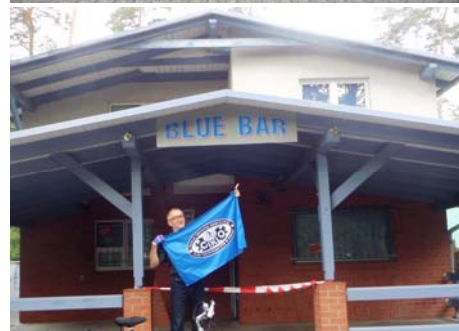
Błękitni CIKLO i BLUE BAR w Przyjezierzu.