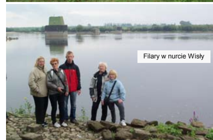
Filary w nurcie Wisły