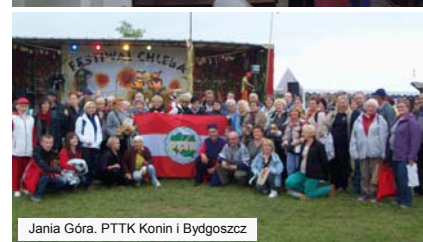
Jania Góra. PTTK Konin i Bydgoszcz