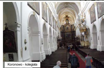
Koronowo - kolegiata