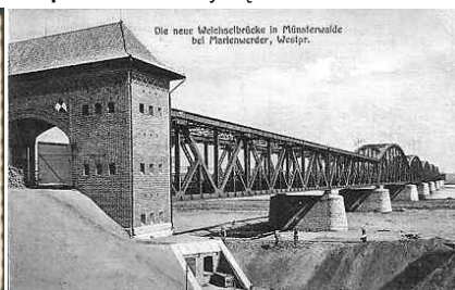
Most kwidziński przed 1914 rokiem. Przyczółek lewobrzeżny. http://www.kaczorek.easysp.pl/pisz/fort/opalen002.htm

Tekst: Wanda Gruszczyńska Zdjęcia: Marek Chlebicki, Michał Gruszczyński Wykorzystano książkę Piotr Rybczyński "Spacerkiem w przeszłość" Wydawnictwo Apeks s.c. Konin 1997 Zapowiedź wycieczki na stronie EDD: http://www.edd2012.pl/page/calendar?id=142&name=Wycieczka-autokarowa-Konin---Jania-Gora---Opalenia---Konin