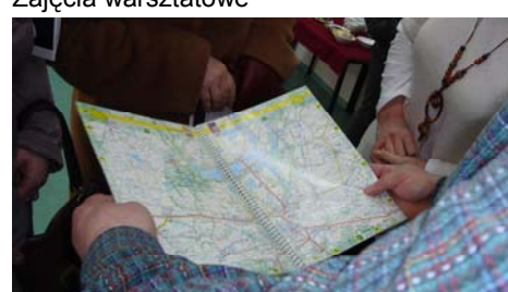
Mapy ułatwiają lokalizację w terenie