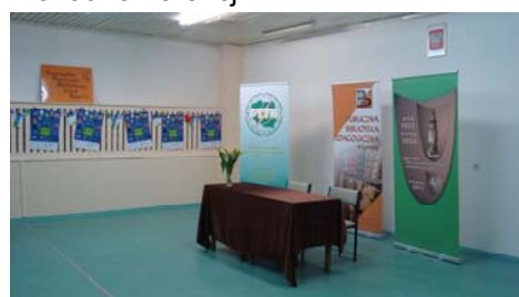
Sala odczytowa PBP