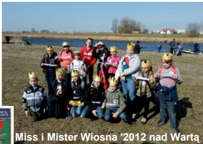
Miss i Mister Wiosna '2012 nad Wartą