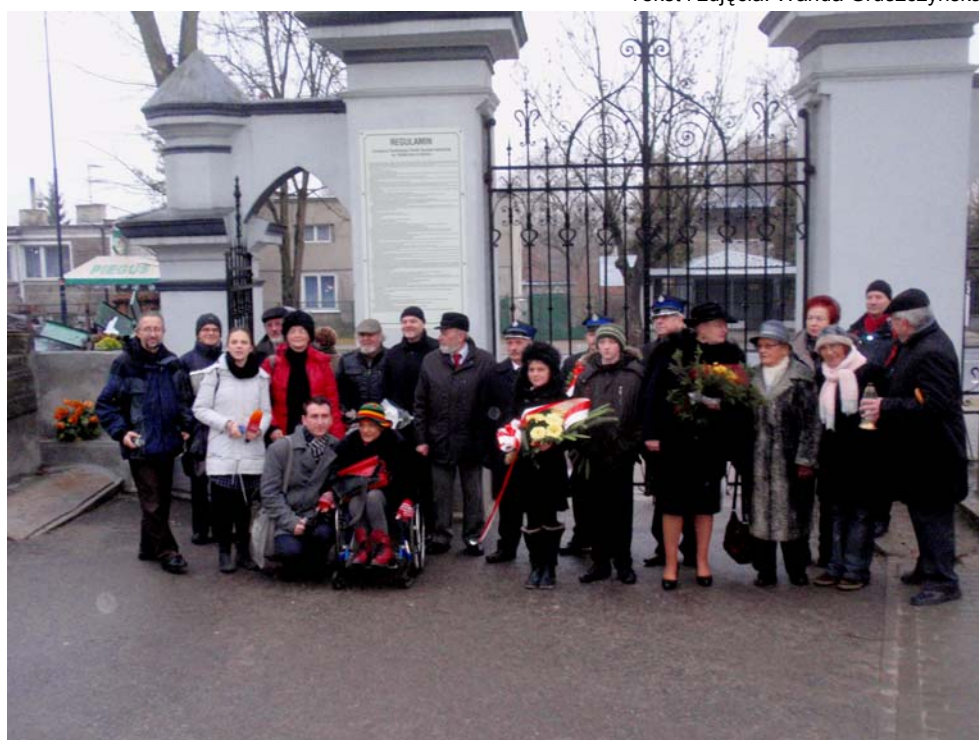
Uczestnicy uroczystości przed bramą cmentarza katolickiego wraz z redaktorami: Radio Merkury, Radio Konin, Głos Wielkopolski - Życie Konina i Przegląd Koniński.