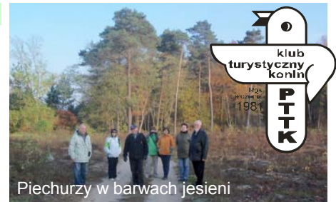
Piechurzy w barwach jesieni