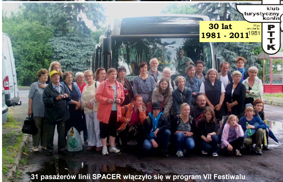
31 pasażerów linii SPACER włączyło się w program VII Festiwalu