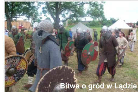
Bitwa o gród w Łądzie