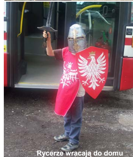
Rycerze wracają do domu