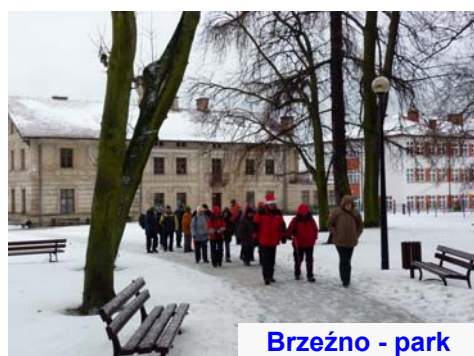
Brzeźno - park