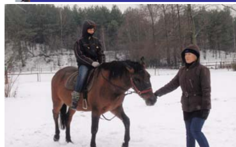
Jazda konna w gosp. PRADOLINA