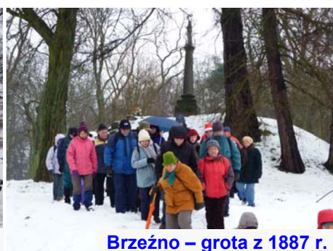
Brzeźno – grotę z 1887 r.