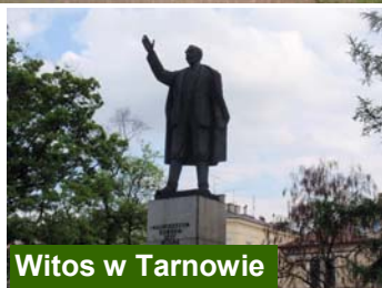
Witos w Tarnowie