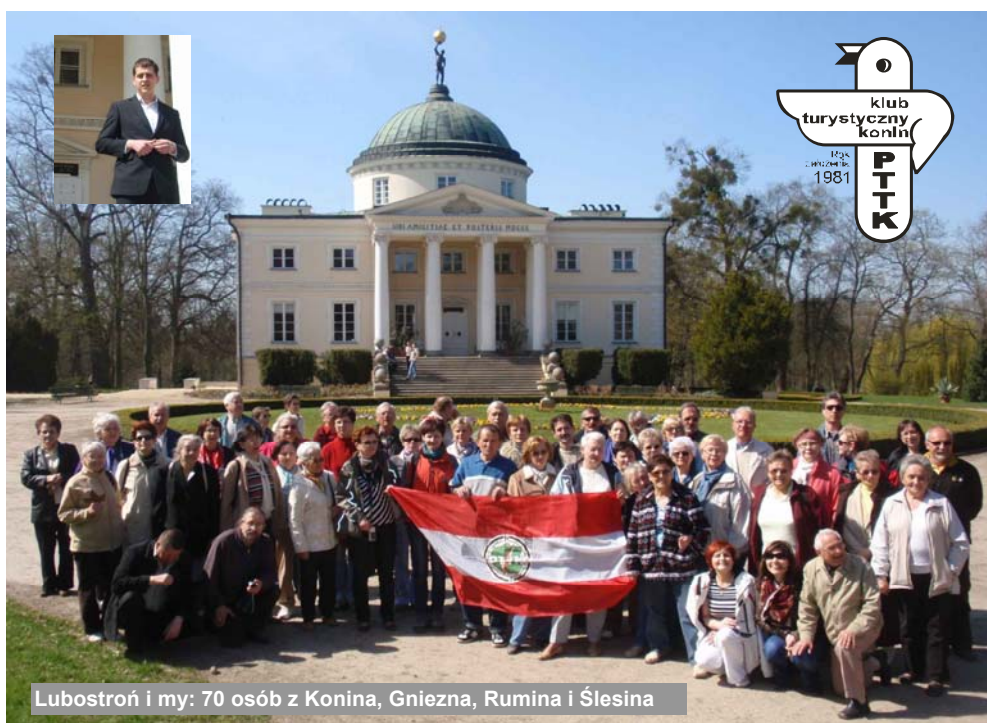
Lubostroń i my: 70 osób z Konina, Gniezna, Rumina i Ślesina