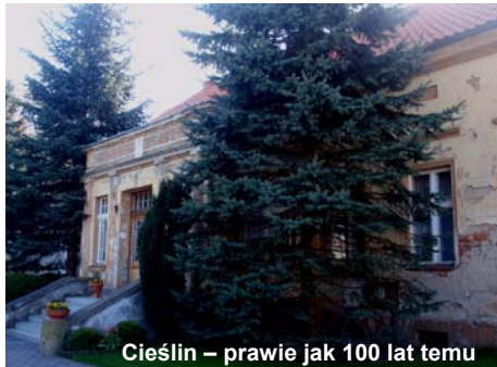
Cieślin – prawie jak 100 lat temu