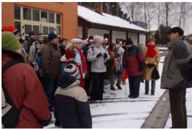
W Nadleśnictwie Konin