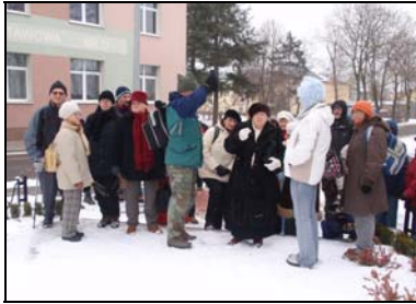
Z panią Z. Olejniczak w Łężynie