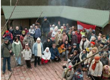
W ostoji koła DROP