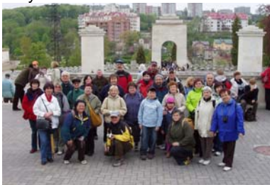
Lwów. Na cmentarzu Łyczakowskim