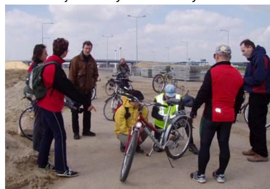
Reporter TV Poznań podczas sprawdzania rowerów