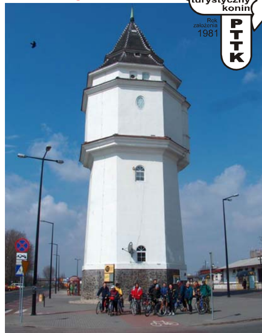
Start w Koninie