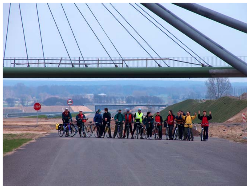
Największe wrażenie wywarł wiadukt WD-161 na drodze Kościelec – Turek