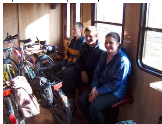
Rowery nakręciły 52 km. Odpoczynek w pociągu