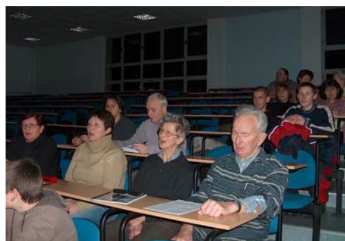
Dzisiaj w Betlejem – śpiewali wszyscy