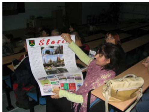
W noworocznej loterii każdy coś wylosował!