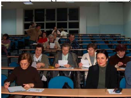
Były relacje z poprzednich i informacje o nowych imprezach