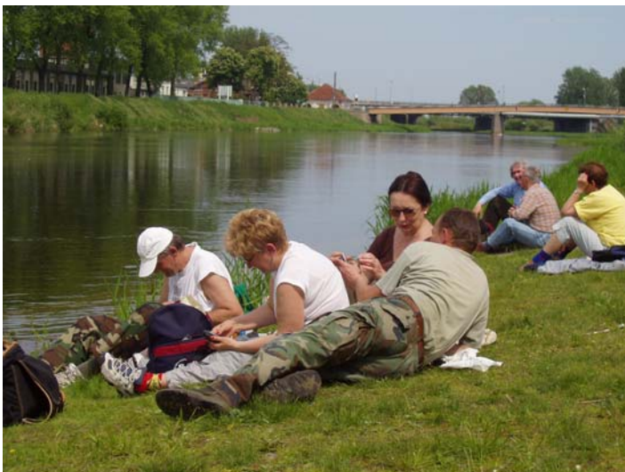
Uczestnicy spaceru marzyli o czystej Warcie i pięknej promenadzie nadrzeznej bez wszechobecnych potłuczonych szkielek i porzuconych papierków