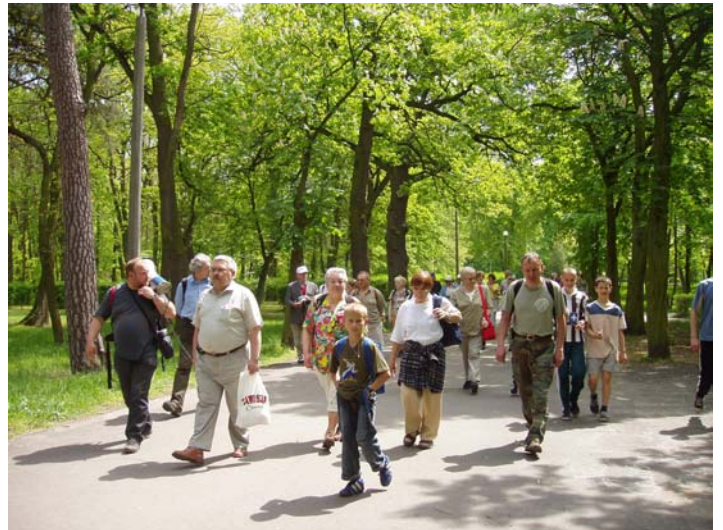
Park miejski na Piaskach zakładano w XIX wieku, a największą popularnością cieszył się w okresie międzywojennym